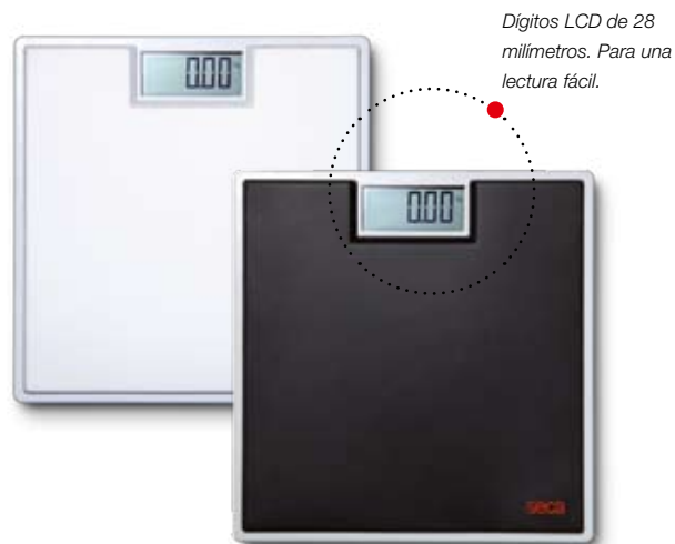
Dígitos LCD de 28 milímetros. Para una lectura fácil.