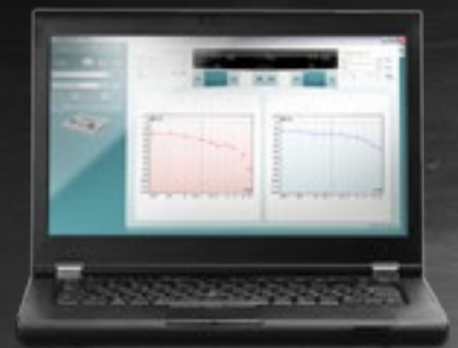
Software Diagnostic Suite (sólo AS608e)

El equipo funciona con 3 pilas AA estándar o mediante fuente de alimentación externa con aprobación médica. Las pilas tienen una duración de seis (6) meses.