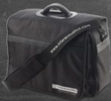
Maletín de transporte

El AS608e incluye el procedimiento de prueba de tono puro automático Hughson Westlake. Al finalizar la prueba, es posible recuperar los resultados de la memoria interna de la unidad con gran facilidad y visualizarlos en el software Diagnostic Suite PC.