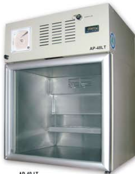
AP 48 LT