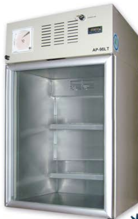
AP 96 LT