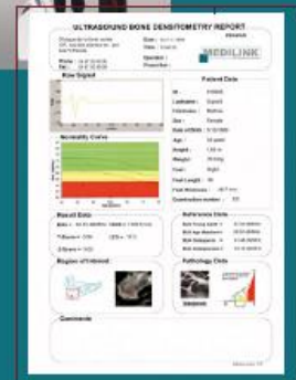
Reporte a color impreso en el modo de escritorio