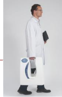
Fácil transportación en el modo portátil

En su modo portátil, el sistema es completamente autónomo y los resultados se imprimen en un registro fácil de leer . Puede almacenar hasta 300 exámenes para después importarlas a la computadora, asegurando de esta manera el seguimiento del paciente. Esta configuración es ideal para los médicos que van de un lugar a otro, también para las farmacias que prestan servicios de exámenes o para las compañías farmacéuticas que realizan las exámenes en conjunto con servicios terapéuticos.