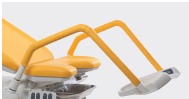
Soportes de piernas estándar