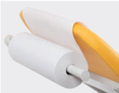
Soporte de rollo de papel (estándar)