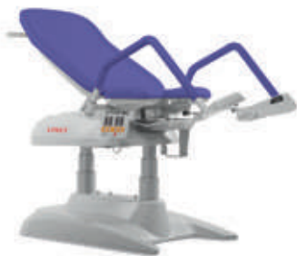
A – Violeta