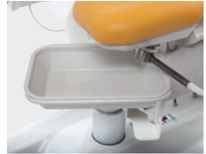
Bandeja de plástico