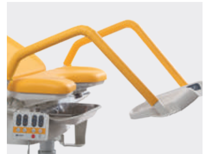
Soportes de piernas con tapicería