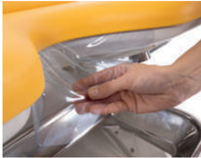
Protección de plástico de la parte inferior de la silla