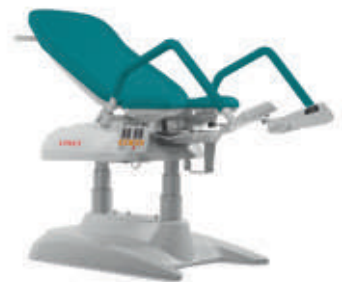
F – Verde océano