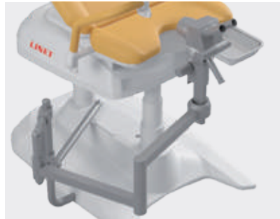
Soporte para colposcopio