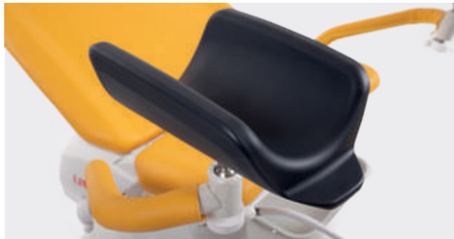
Soportes de piernas Goepel

La silla Graciella® dispone de diferentes soportes de piernas que se pueden seleccionar en función del objetivo o de las exploraciones ginecológicas más frecuentes en cada centro de salud. Los soportes de piernas se pueden ajustar de acuerdo con las necesidades de la paciente y del ginecólogo.