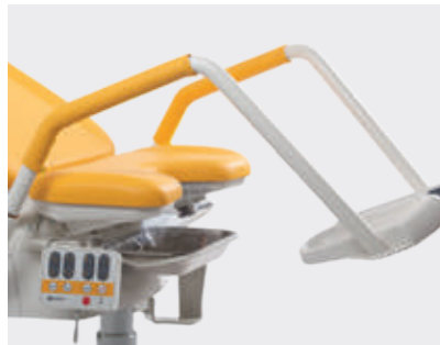
Soportes de piernas con tapicería parcial