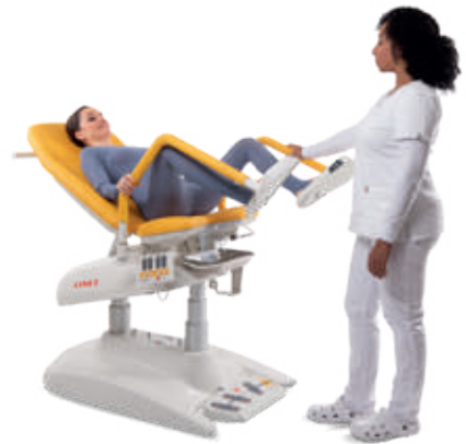
Posición de reconocimiento