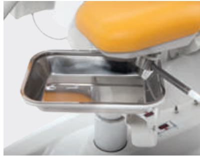
Bandeja de acero inoxidable