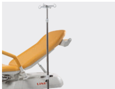
Soporte de portasueros