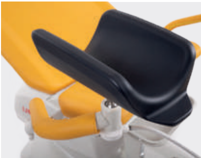
Reposapiernas tipo Goepel