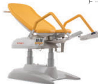
P – Naranja