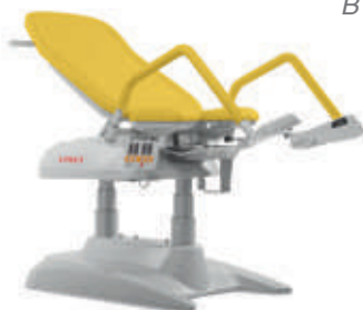
M – Amarillo maíz