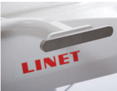
Soporte de barandilla UE