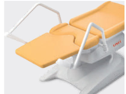
Base para las piernas