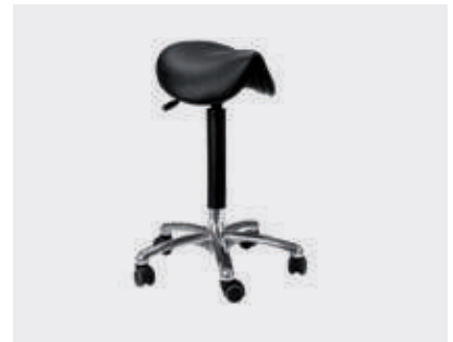
Silla del médico: ergonómica, altura ajustable, bloqueo manual