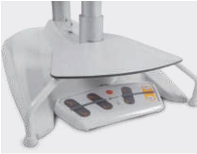
Peldaño de subida