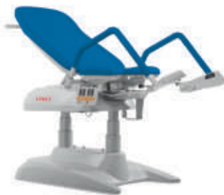
B – Azul brillante