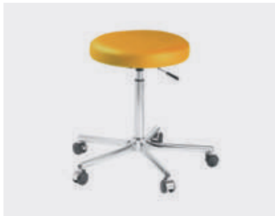
Silla del médico: altura ajustable, bloqueo manual