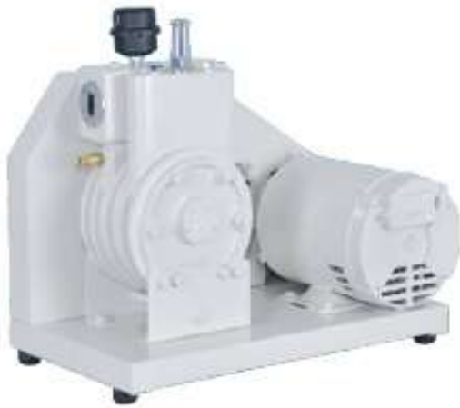
FE-1405 60 l/min