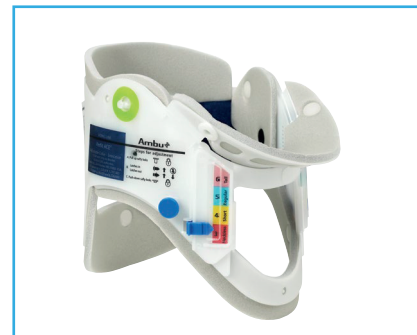
Ambu® Perfit ACE®.