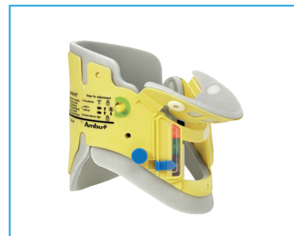
Ambu® Mini Perfit ACE®.